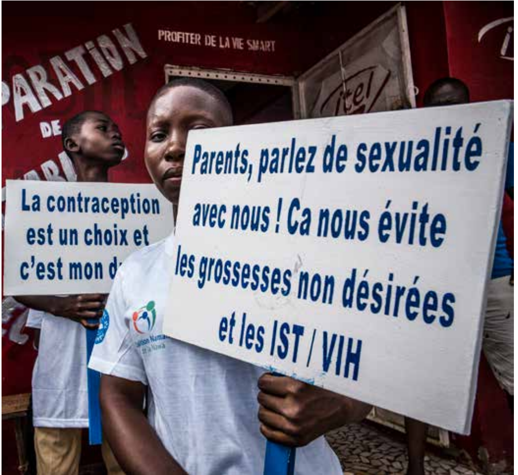
Médecins du Monde soutient les initiatives de la société civile et des jeunes pour le droit à l'information sur la sexualité et la contraception. Septembre 2018, Soubré, Côte d'Ivoire.