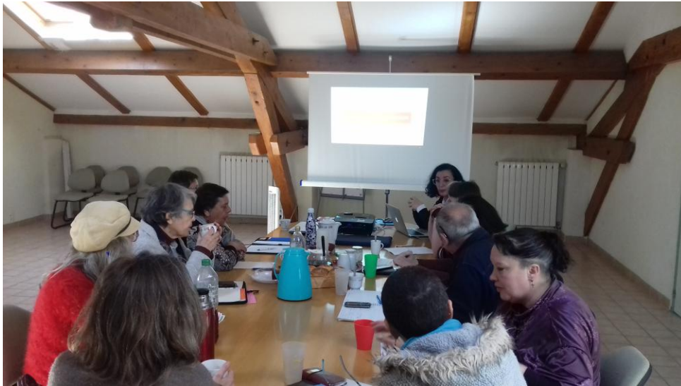
Le Groupe de Soutien Mutuel des femmes ayant connu des violences