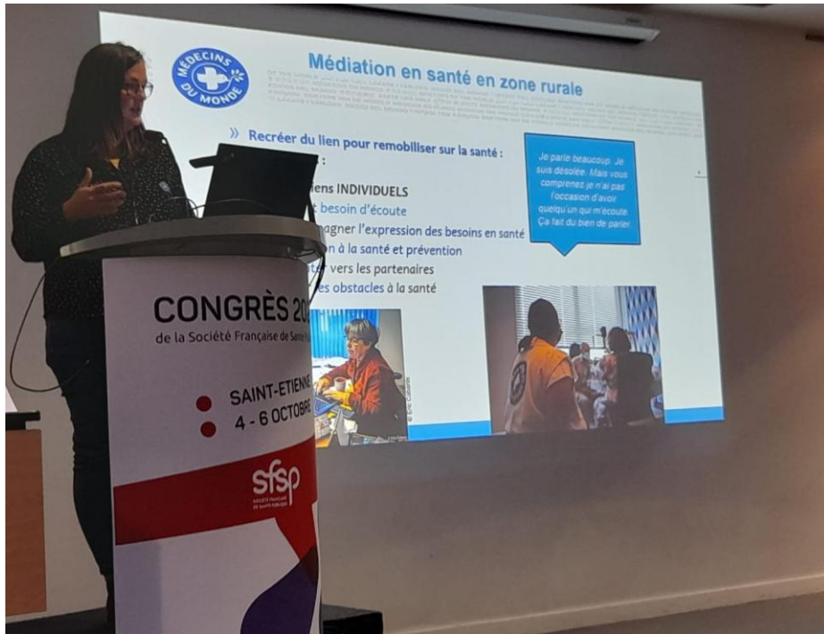
Congrès SFSP 2023