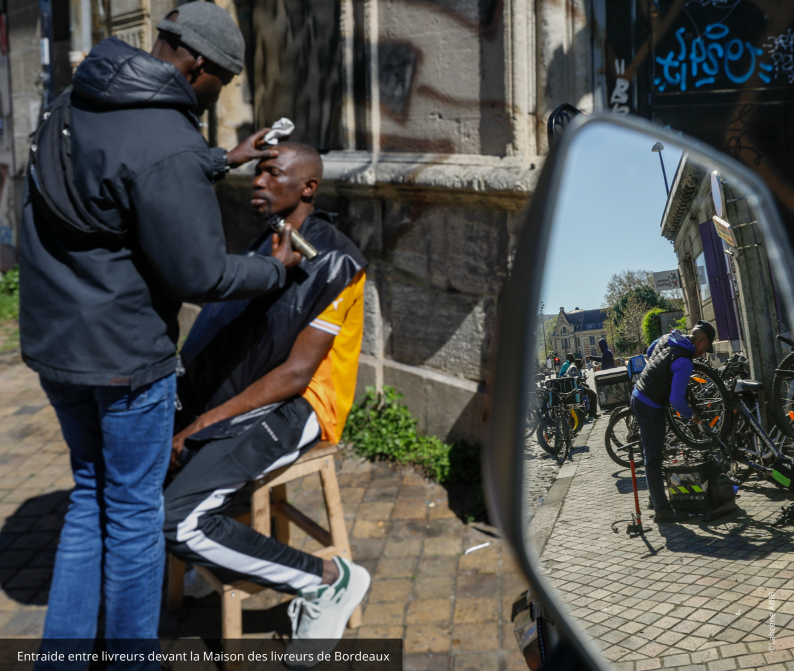
Entraide entre livreurs devant la Maison des livreurs de Bordeaux