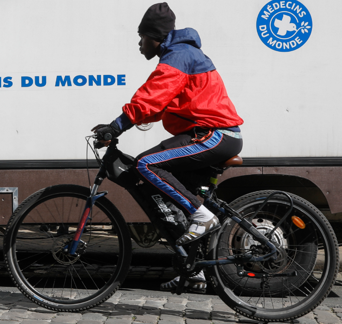
Camion de Médecins du Monde stationné devant la Maison des livreurs de Bordeaux