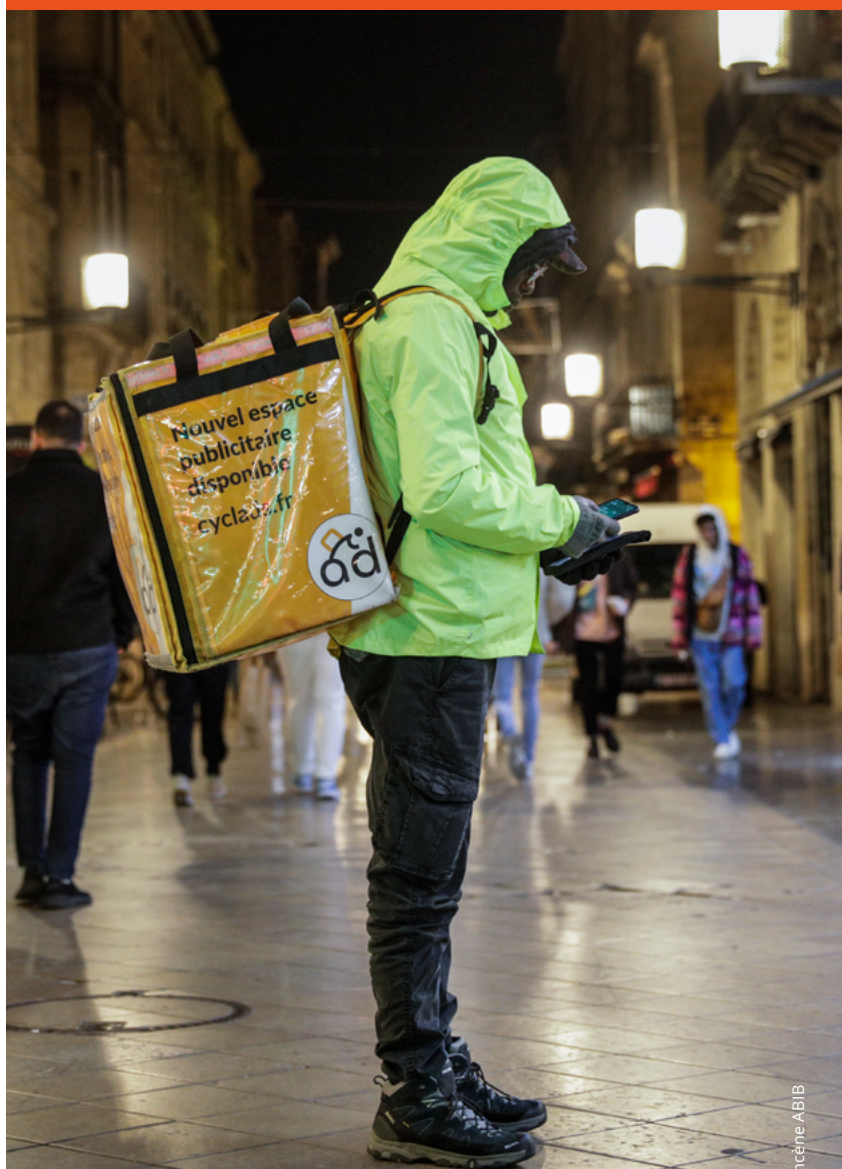
Livreur patientant devant un restaurant

À Rouen, l'équipe du programme Médiation Exil Droits Santé (MEDS) de Médecins du Monde, partant des besoins exprimés par les livreurs de l'Association de Soutien et d'Accompagnement des Livreurs de Rouen (ASALR), a organisé en 2025 en partenariat avec l'association Avélo, un cycle d'ateliers de sensibilisation sur les enjeux de sécurité routière et risques routiers avec la réalisation d'un livret pratique sur le sujet.