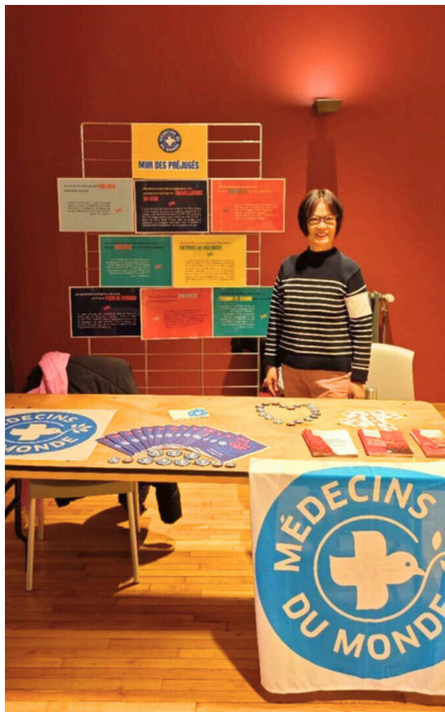
La médiatrice en santé du Lotus Bus, à la journée santé des femmes dans le 13ème arrondissement en 2025.

Fermer un programme aussi emblématique et riche que le Lotus Bus n'est pas chose facile. Nous sommes très fier.es du travail colossal qui a été mené depuis la création du programme. En effet, nous avons mis en place des activités dans une logique partenariale et œuvré afin que ces dernières puissent perdurer au-delà de notre présence grâce à la mobilisation des Roses d'Acier et l'appui des institutions publiques. Aujourd'hui, nous sommes plein-es d'espoir quant à l'avenir.