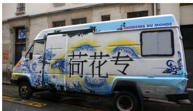
Le Bus du Lotus Bus en 2007, avant son incendie.

→ Nous proposons également à nos usagères un accompagnement individuel dans leurs démarches au niveau médical (SSR, TRODs VIH-VHC-Syphilis, partenariat avec centres de santé, planning familial et Cegidd, soutien psychologique), social (couverture maladie) et juridique (accompagnement victimes de violences dans les procédures judiciaire, préfecture - droit au séjour victimes de proxénétisme). En ce qui concerne les personnes ayant subi des violences dans le cadre de leur activité, nous proposons une prise en charge globale (médicale, psychologique, juridique et sociale). Nous accompagnons également physiquement les personnes dans les structures de santé et de droits, notamment pour y promouvoir l'interprétariat et la médiation. Cela permet également de sensibiliser le personnel de santé et des institutions aux spécificités de notre public afin de permettre une meilleure prise en charge.