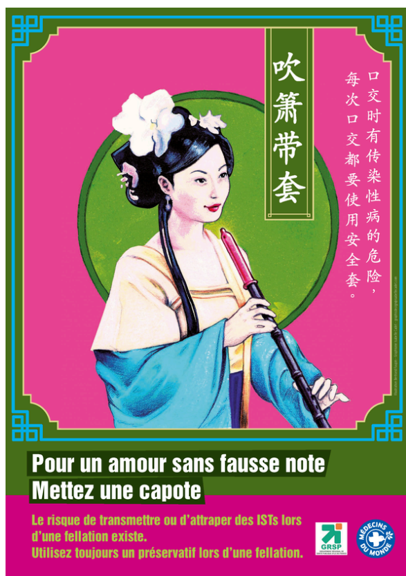
Affiche de prévention conçue pour les femmes chinoises par MdM et GRSP.

Le programme Lotus Bus est mis en œuvre via deux axes principaux : des actions de réductions des risques et un accompagnement et un suivi individuels dans les démarches médicales, sociales et juridiques avec un accompagnement vers les structures de soins et sociojuridiques du droit commun.