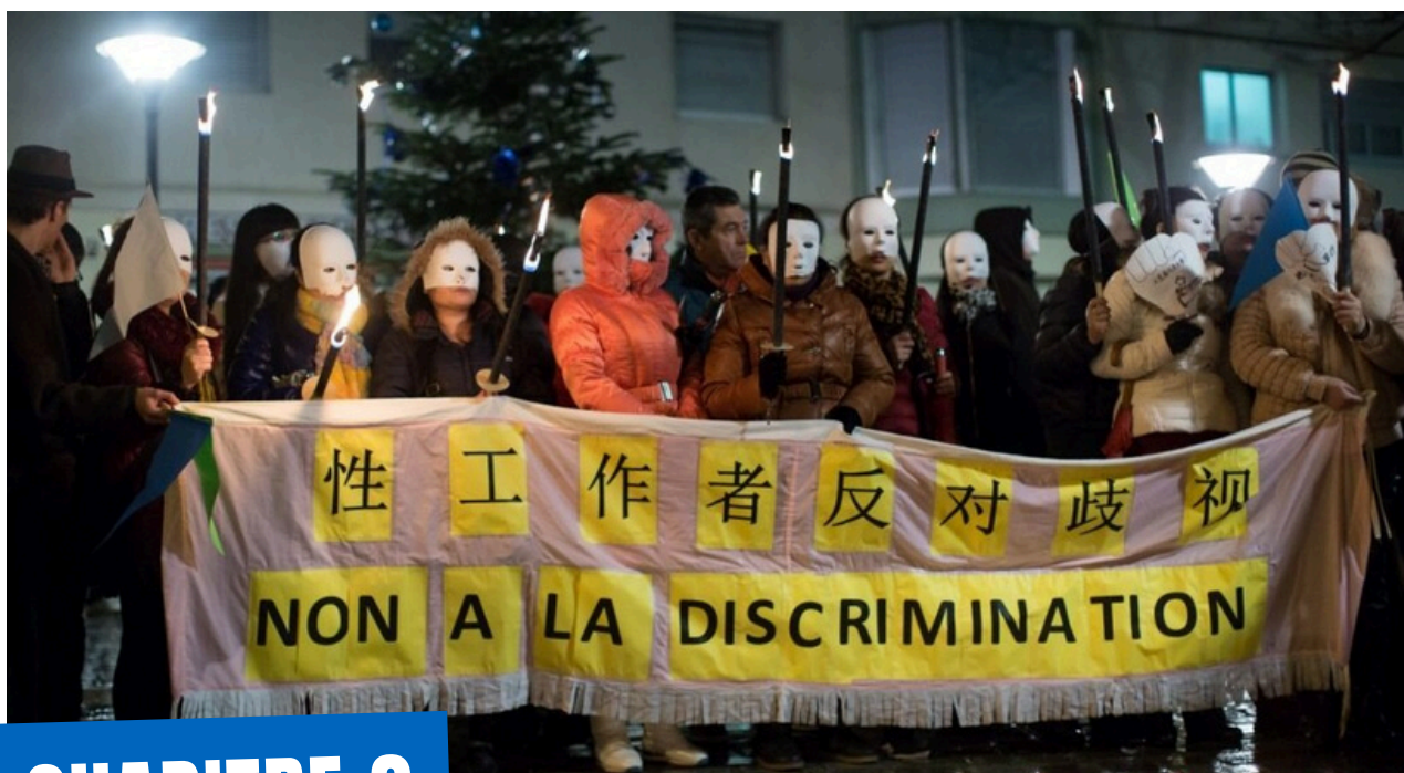
Les Roses d'acier lors d'une manifestation contre les discriminations en 2016. © Nick Kosak